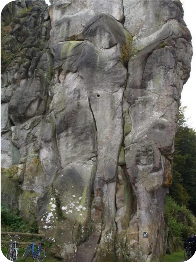
Externsteine: Odin of Hangagod

Het was Boeddha die de mensheid hierop attendeerde met de leer van Liefde en mededogen. En dat wat zich nu voorzichtig aandient in het eigen hart en ziel is voorbij aan de leer; het is de kracht van mededogen en (de ontwakende) Liefde: zacht, teder en kwetsbaar en tegelijk sterk aanwezig.