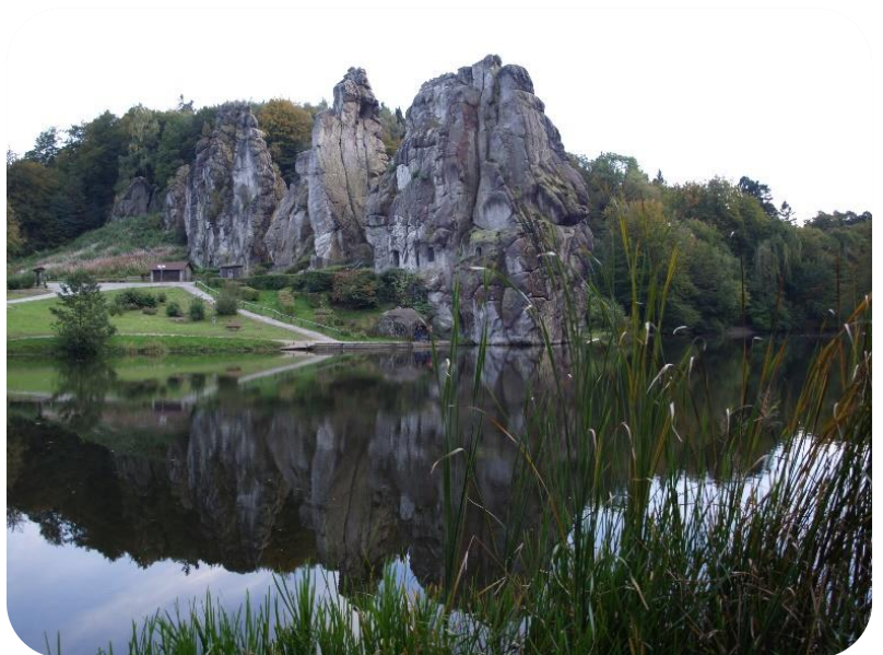
De oude mysterie-inwijdingsplaats Externsteine Duitsland

Door deze intense ervaring zijn we de 2 e fase op de Moderne inwijdingsweg binnengetreden. Met de nadruk op ‘ binnen ’. Waar we eerder nog de antwoorden ‘buiten onszelf’, in de buitenwereld zochten en konden vinden, lukt dat niet meer. Geleidelijk groeit het inzicht dat de echte antwoorden alleen in ‘mijn binnenste kamer’, het eigen hart en ziel te vinden zijn.